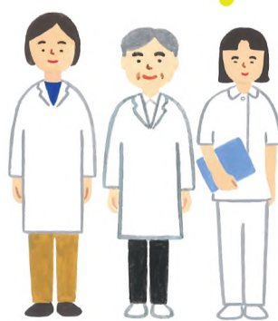
現場の医療チーム