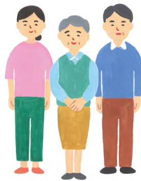
患者さんやご家族

Q どんな人が メンバーなの？ それぞれの専門を持つ 多職種が柔軟にかかわります 客観的な立場だからこそ見える ことがあります。また医学におけ る「生命倫理の4原則」に基づく情 報整理のスキルを学んだメンバ ーが、問題解決に向けて話し合いの焦 点を絞り込むための、専門的な助 言を行います。