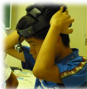
H24 中高生対象医師体験講座